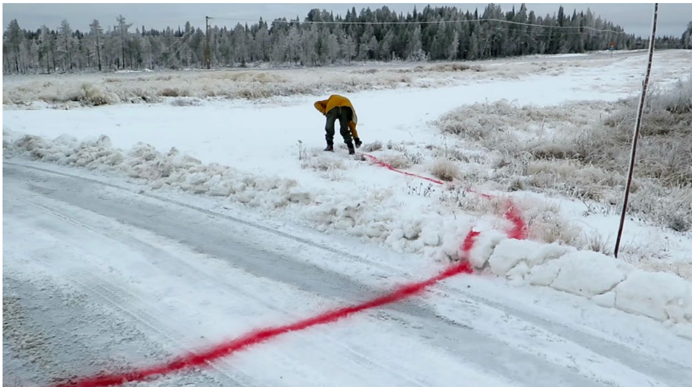
Det som sågs, kunde ses (2018). Residence-in-Nature/Lainio och Norrbottens Museum, Luleåbiennalen 2018.

Lisa Torell använder sig av platsers inneboende struktur eller särskilda funktioner både som material och metod, för att tillsammans